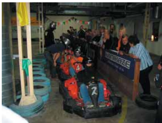
Na závodní dráze to opravdu vřelo...