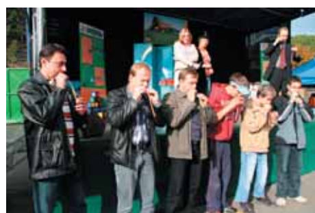
Do soutěží se zapojili i dospělí