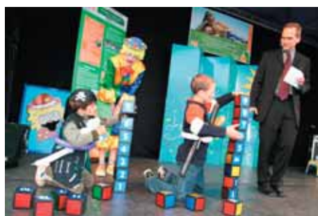
Na pódiu se bojovalo jako o život