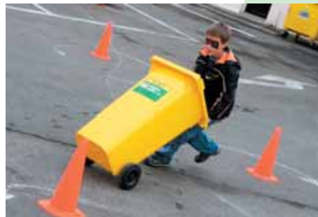
Jedna ze soutěžních disciplín – běh s popelnicí na čas