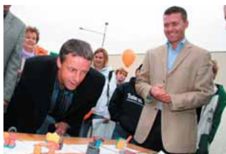
Pan primátor bral za dohledu pana ředitele svou úlohu porotce více než zodpovědně