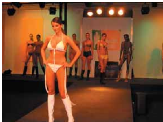
Všechny přítomné pány jistě potěšila módní přehlídka