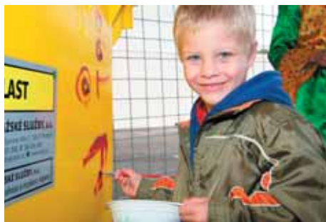
Až budu velký budu popelář nebo možná malíř?