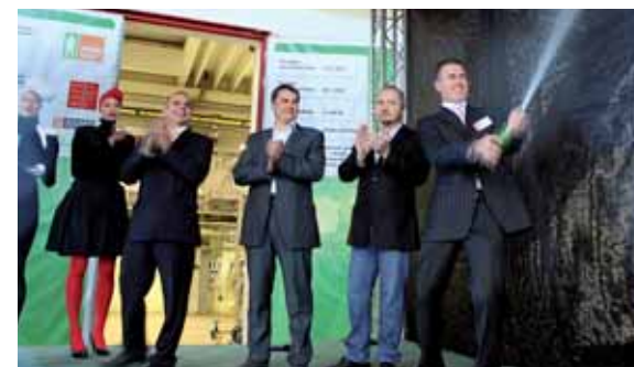
Lilith zažila velkou oslavu

Pražské služby, a. s., počátkem října 2010 slavnostně zahájily provoz turbogenerátoru kogenerační jednotky v Zařízení na energetické využití odpadu – ZEVO Malešice, která umožní vyrábět z odpadu nejen tepelnou energii, ale také elektrickou. Pražany tak jejich odpad bude nejen hřát, ale také jim svítit, a to ve 20 000 domácnostech. Turbinu, která je srdcem jednotky, realizátoři poetically pojmenovali Lilith – jménem symbolizujícím prvotnost, touhu, nezávislost, vzdor a krásu.