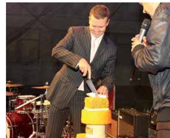
Generální ředitel rozkrojil slavnostní dort

Kogenerační jednotka je technologie, díky níž budeme moci v procesu energetického využití odpadů z vypro-