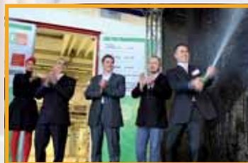
3 AKCE ROKU 2010