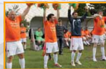
8 PS FOTBALOVÝ TÝM