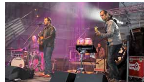
Součástí zahájení byl i hudební program